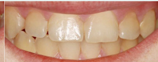
Behandlungsergebnis nach der Kariesinfiltration.